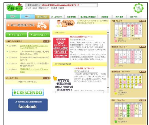
【No5 [大植ねっと]コミュニティーサイト トップ画面】