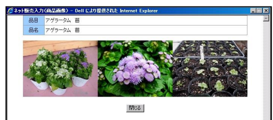
【No10 ネット販売 商品画像確認画面】