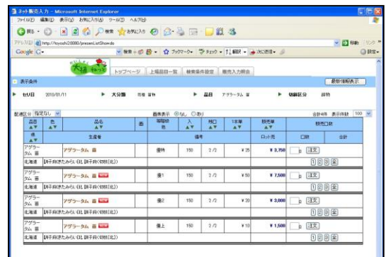
【No7 ネット販売 ネット購入画面】