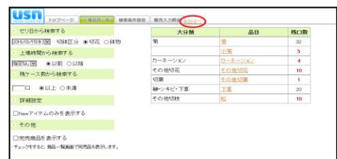
【No6 ネット販売 ネット購入画面】